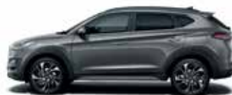
Gri Micron (metalic)