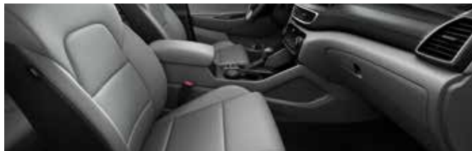
Negru / Gri