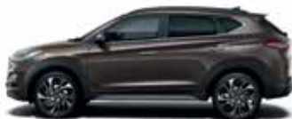
Gri Moon Rock (metalic)