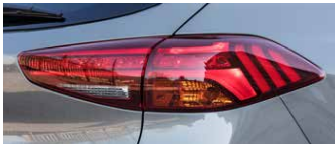
Noua forma a blocurilor optice cu LED.