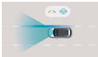
Asistență la menținerea benzii de rulare (LKA)