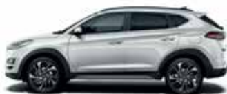
Argintiu Platinum (perlat)