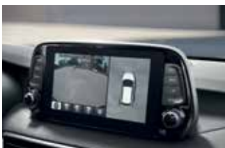
Sistem de monitorizare 360°