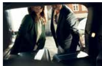
Portbagaj cu deschidere automată