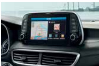
Sistem de navigație cu ecran de 8 inch