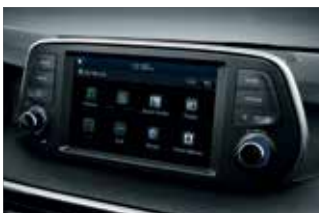
Display audio de 7 inch - Apple CarPlay / Android Auto