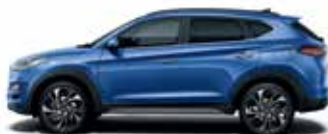
Albastru Champion (metalic)