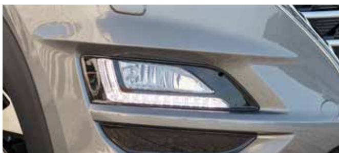
Noile faruri duble - cu lumini de zi de tip LED cu asistență pentru faza lungă (HBA).