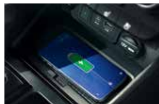
Încărcător wireless, AUX, USB