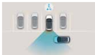
Sistem de avertizare pentru evitarea coliziunilor la deplasarea în marșarier (RCCW)