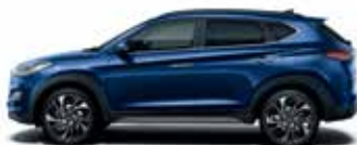
Albastru Stelar (metalic)