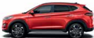
Roșu Engine (solid)