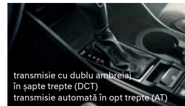
transmisie cu dublu ambreiaj în șapte trepte (DCT) transmisie automată în opt trepte (AT)

Informațiile prezentate în acest pliant se bazează pe datele disponibile la momentul publicării. Acestea sunt orientative și nu reprezintă parte integrantă a ofertei de produs. Este posibil ca unele echipamente ilustrate sau prezentate să nu fie disponibile în echiparea standard, putând fi achiziționate contra cost. Hyundai Auto România își rezervă dreptul de a schimba specificațiile tehnice și echipările fără un anunț prealabil. Garanția de cinci ani fără limită de kilometri se aplică doar autovehiculelor Hyundai care au fost vândute inițial de către distribuitorul autorizat Hyundai către clientul final, conform termenelor și condițiilor prezentate în pașaportul de service. Pentru informații complete, vă rugăm să contactați distribuitorii Hyundai Auto România. Imaginile disponibile sunt cu titlu de prezentare.