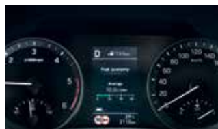
Funcția inteligentă de avertizare asupra vitezei limită (ISLW)