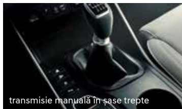
transmisie manuală în șase trepte