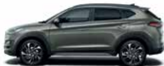
Gri Olivine (metalic)