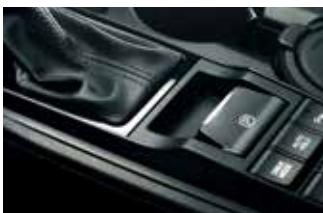
Frână de mână acționată electric