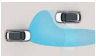
Faruri cu tehnologie LED cu asistență pentru faza lungă (HBA)