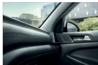
Interior cu materiale de calitate