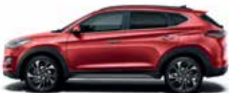
Roșu Fiery (metalic)