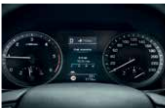
Sistem de afișare Supervision