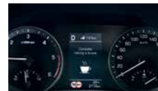
Sistem de atenționare a conducătorului auto (DAW)