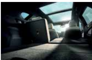
Banchete spate rabatabile 60:40