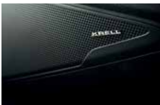
Sistem audio Krell