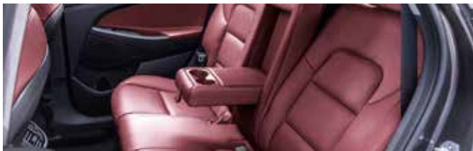
Negru / Roșu