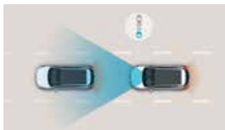
Asistență la coliziune frontală (FCA) cu detectarea pietonilor