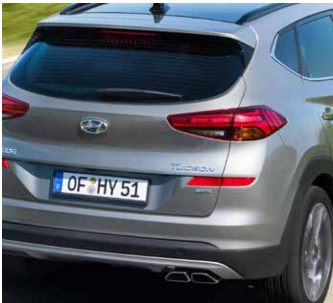
Stopurile și bara de protecție au fost redeseinate.