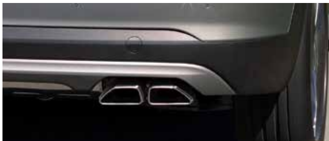
Sistem de evacuare dublă cu inserții cromate.