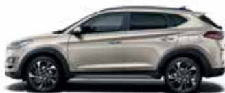
Alb Sand (metalic)