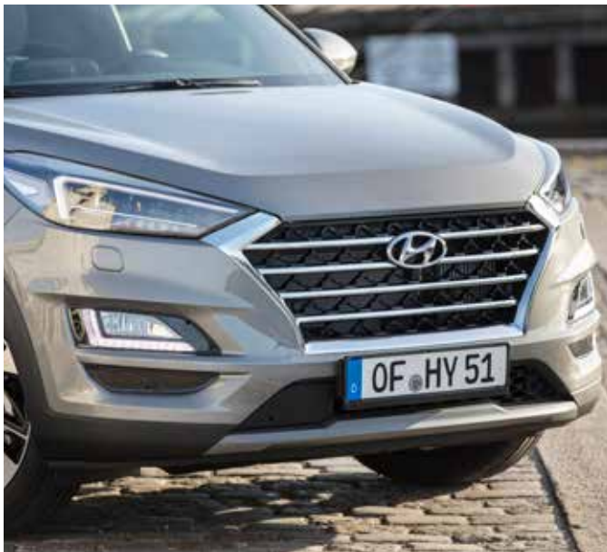
Grila frontală tip cascadă subliniază apartenența la familia de modele Hyundai.