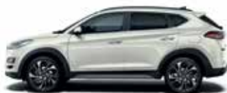
Alb Polar (solid)