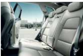
Tapiserie din piele