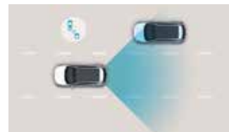
Sistem de monitorizare a unghiului mort (BSW)