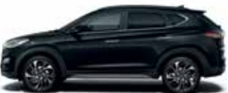
Negru Phantom (perlat)