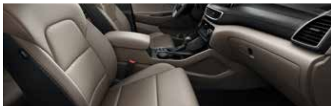
Bej Sahara – două tonuri