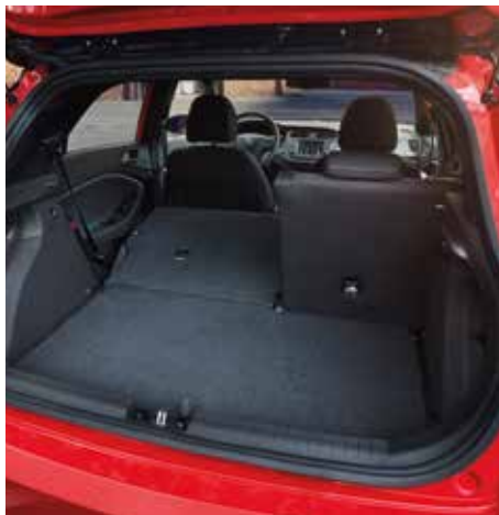
Sistem de rabatare scaune spate 60:40