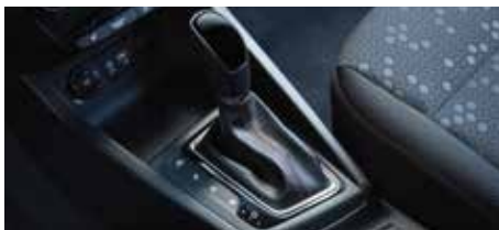
Transmisie automată cu șapte trepte și dublu ambreiaj (DCT)