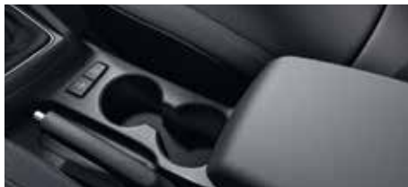
Cotiera centrală și suport pentru pahare