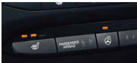
Volan / Scaune încălzite