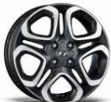
jante din aliaj de 16" (nou)