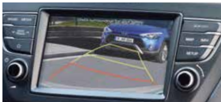
Cameră video marșarier