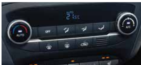
Instalație de climatizare automată