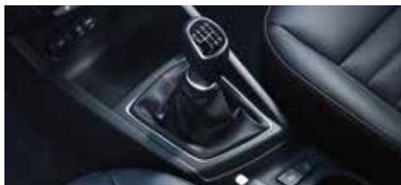
Transmisie manuală cu șase trepte