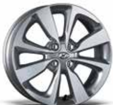
jante din aliaj de 16"