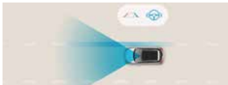
Asistență la menținerea benzii de rulare (LKA)