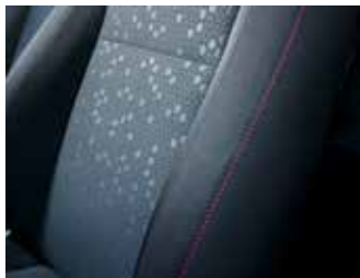
Material textil / inserții de culoare roșie