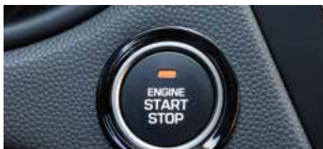
Buton pornire/oprire a motorului („Start/Stop”)