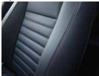
Piele neagră / inserții de culoare roșie