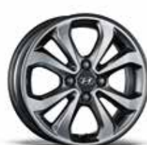
jante din aliaj de 15"

Mostrele de culoare prezentate pot varia ușor față de realitate, din cauza condițiilor de iluminare și a procesului de tipărire. Pentru informații complete, vă rugăm să contactați distribuitorii Hyundai Auto România.