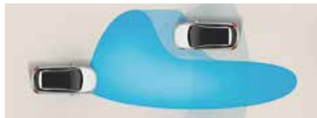
Asistență pentru faza lungă (HBA)