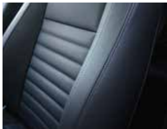
Piele neagră / inserții de culoare albastră