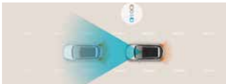
Sistem de asistență la coliziune frontală (FCA)