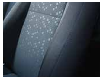
Material textil / inserții de culoare albastră