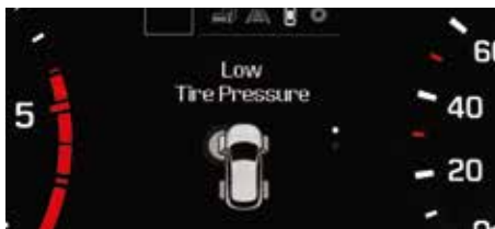
Sistem de monitorizare a presiunii în pneuri