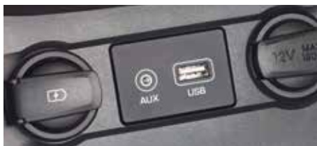
Conectivitate - porturi USB și AUX