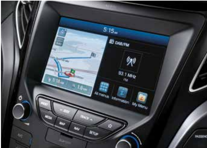
Sistem de navigație cu ecran de 7 inchi

Hyundai i40 dispune de tehnologii avansate de siguranță și confort, pentru protecția conducătorului auto și a pasagerilor.