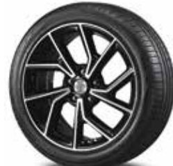
Jante aliaj 18"

Mostrele de culoare prezentate pot varia ușor față de realitate, din cauza condițiilor de iluminare și a procesului de tipărire. Pentru informații complete cu privire la disponibilitatea culorilor și a tapițeriei, vă rugăm să contactați distribuitorii Hyundai Auto România.