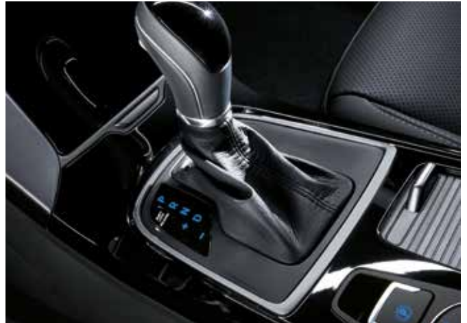
Tehnologie dublu ambreiaj