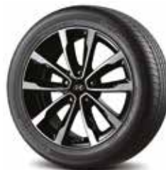
Jante aliaj 17"