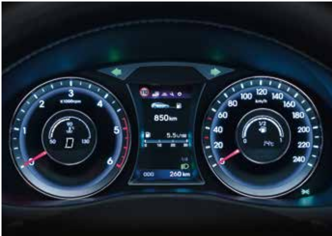
Ecran de bord Supervision TFT LCD de 4.2"