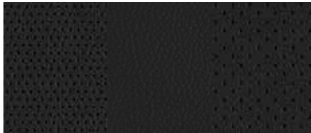
Tapițerie piele - Negru