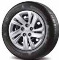
Jante oțel 16"