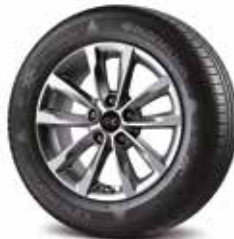
Jante aliaj 16"