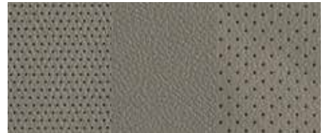
Tapițerie piele - Bej