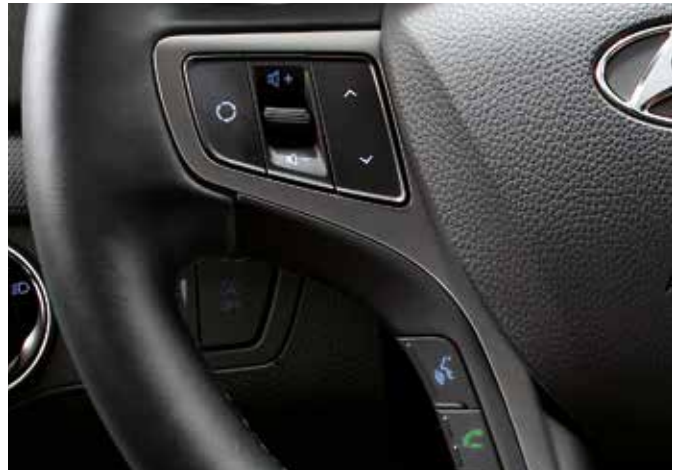
Comenzi pe volan