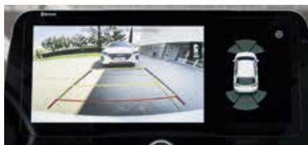
Camera pentru marșarier