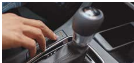
Scaune față încălzite