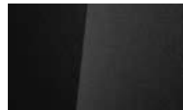
Negru Phantom Perlat (PAE)