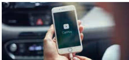
Funcții de conectivitate Apple CarPlay™ și Android Auto™