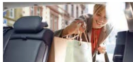
Spațiu generos pentru bagaje