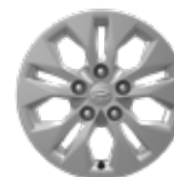
Jante din oțel de 15"

Informațiile prezentate în acest pliant se bazează pe datele disponibile la momentul publicării. Acestea sunt orientative și nu reprezintă parte integrantă a ofertei de produs. Este posibil ca unele echipamente ilustrate sau prezentate să nu fie disponibile în echiparea standard, putând fi achiziționate contra cost. Hyundai Auto România își rezervă dreptul de a schimba specificațiile tehnice și echipările fără un anunț prealabil. Garanția de 5 ani fără limită de kilometri se aplică doar autovehiculelor Hyundai care au fost vândute inițial de către distribuitorul autorizat Hyundai către clientul final, conform termenelor și condițiilor prezentate în pașaportul de service. Pentru informații complete, vă rugăm să contactați distribuitorii Hyundai Auto România. Imaginile disponibile sunt cu titlu de prezentare.