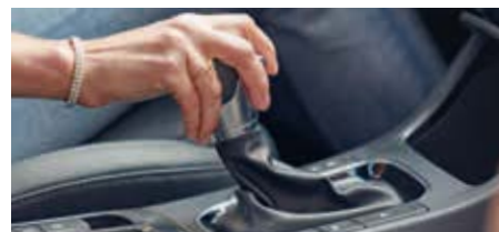
Transmisie automată în 7 trepte cu dublu ambreiaj (7DCT)

*Apple CarPlay™ este marcă înregistrată a Apple Inc. Android Auto™ este marcă înregistrată a Google Inc.