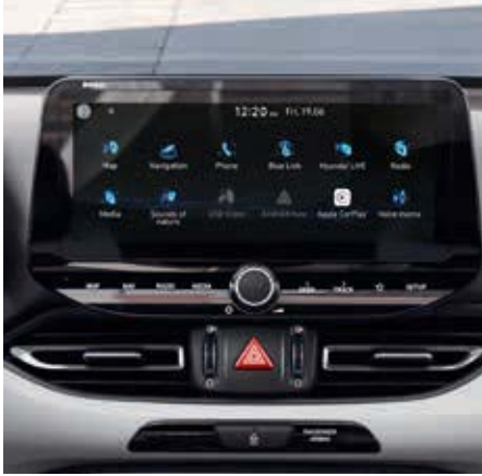
Display central de 10,25 inch.