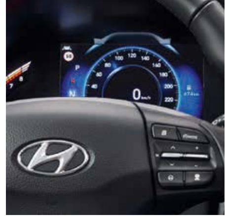
Instrumentar de bord de 7 inch.