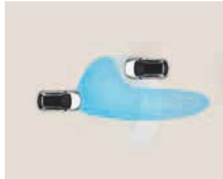
Sistem de asistență pentru faza lungă (HBA).