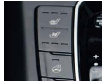
Scaune față încălzite.