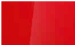
Roșu Engine Solid (JHR)