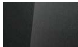
Gri Dark Knight Perlat (YG7)