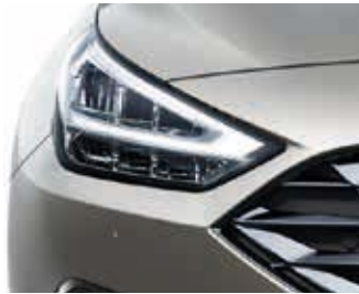
Faruri cu LED.