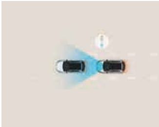
Sistem de asistență la coliziune frontală (FCA) cu detectare autovehicule și pietoni.