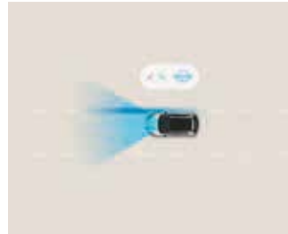
Sistem de asistență la păstrarea benzii de rulare (LKA).