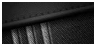
Material textil și piele