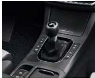
Transmisie automată în 7 trepte cu dublu ambreiaj (7DCT).