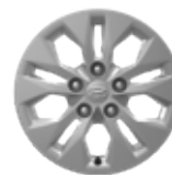
Jante din oțel de 15"

Informațiile prezentate în acest pliant se bazează pe datele disponibile la momentul publicării. Acestea sunt orientative și nu reprezintă parte integrantă a ofertei de produs. Este posibil ca unele echipamente ilustrate sau prezentate să nu fie disponibile în echiparea standard, putând fi achiziționate contra cost. Hyundai Auto România își rezervă dreptul de a schimba specificațiile tehnice și echipările fără un anunț prealabil. Garanția de 5 ani fără limită de kilometri se aplică doar autovehiculelor Hyundai care au fost vândute inițial de către distribuitorul autorizat Hyundai către clientul final, conform termenelor și condițiilor prezentate în pașaportul de service. Pentru informații complete, vă rugăm să contactați distribuitorii Hyundai Auto România. Imaginile disponibile sunt cu titlu de prezentare.