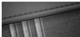
Material textil și piele

*Disponibil doar pentru echiparea N Line.