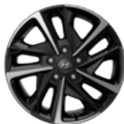
Jante din aliaj de 17"