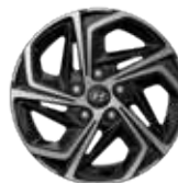
Jante din aliaj de 16"