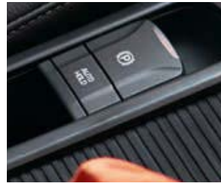
Frână de mână electrică.