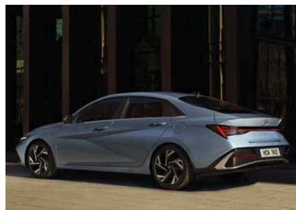
Sistem de asistență pentru menținerea benzii de rulare (LKA)