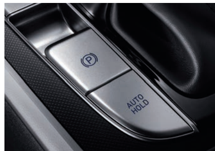
Frână electrică de staționare