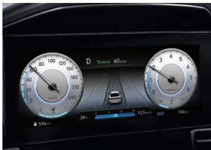
Sistem de iluminare a bordului cu display de 10,25"