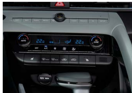
Sistem automat de climatizare