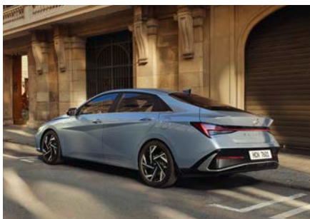
Sistem de asistență la coliziunile frontale (FCA cu funcție de prevenire a coliziunilor în intersecții)