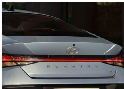
Cameră video spate