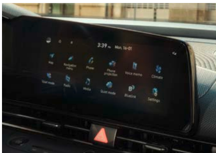
Display central de 10,25 inchi