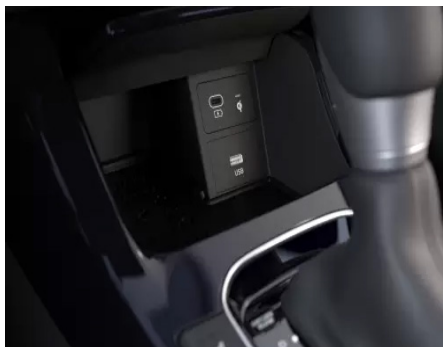
Suport pentru încărcare wireless prin inducție.