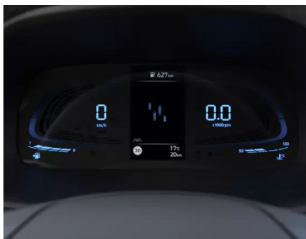
Instrumentar digital de 10,25".