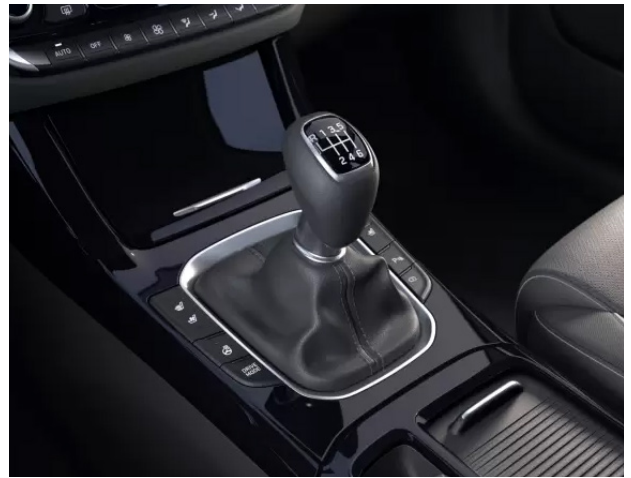
Cutie de viteze manuală în 6 trepte