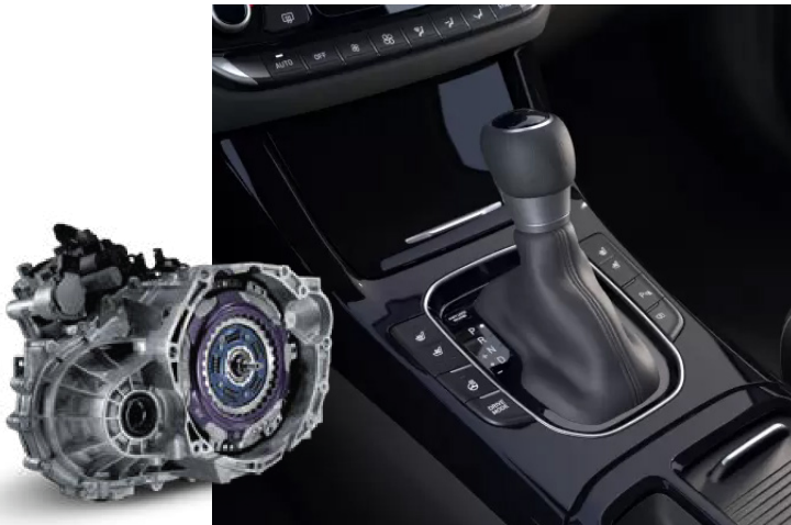
Transmisie cu dublu ambreiaj în 7 trepte