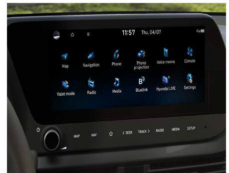
Ecran de 10,25 inchi.