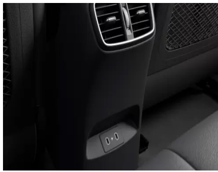
Porturi de încărcare USB tip C în față/ spate.