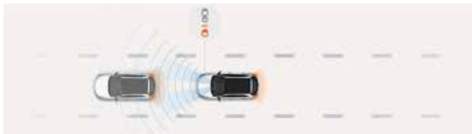
Sistem autonom de frânare (FCA)