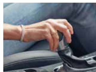
Transmisie automată în șapte trepte cu dublu ambreiaj (7DCT)