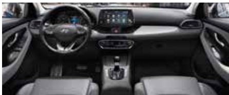
Negru și gri