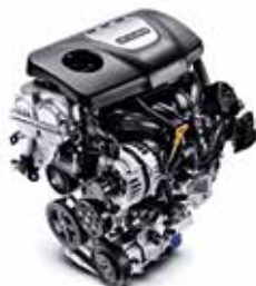
1.0 T-GDi (120 CP)