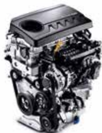
1.4 T-GDi (140 CP)