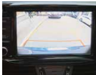
Camera pentru marșarier