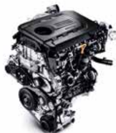
1.6 CRDi (95 / 110 / 136 CP)