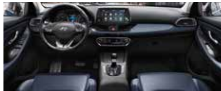
Negru și albastru