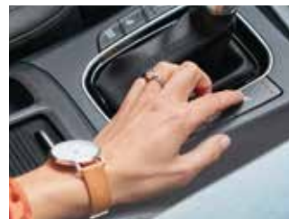
Frână de mână electronică

Informațiile prezentate în acest pliant se bazează pe datele disponibile la momentul publicării. Acestea sunt orientative și nu reprezintă parte integrantă a ofertei de produs. Este posibil ca unele echipamente ilustrate sau prezentate să nu fie disponibile în echiparea standard, putând fi achiziționate contra cost. Hyundai Auto România își rezervă dreptul de a schimba specificațiile tehnice și echipările fără un anunț prealabil. Garanția de cinci ani fără limită de kilometri se aplică doar autovehiculelor Hyundai care au fost vândute inițial de către distribuitorul autorizat Hyundai către clientul final, conform termenelor și condițiilor prezentate în pașaportul de service. Pentru informații complete, vă rugăm să contactați distribuitorii Hyundai Auto România. Imaginile disponibile sunt cu titlu de prezentare.