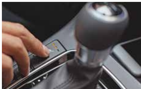
Scaune față încălzite