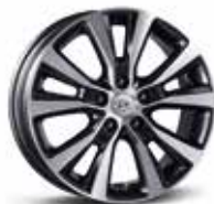
Jante din aliaj de 17"