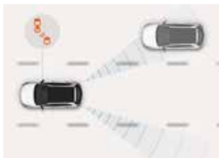
Sistem de monitorizare a unghiului mort (BCW)