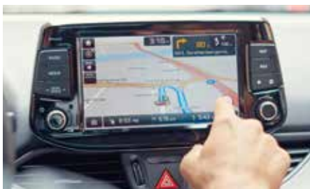
Ecraan tactil de 8"