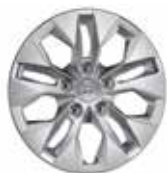
Jante din oțel de 15"