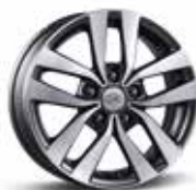
Jante din aliaj de 16"