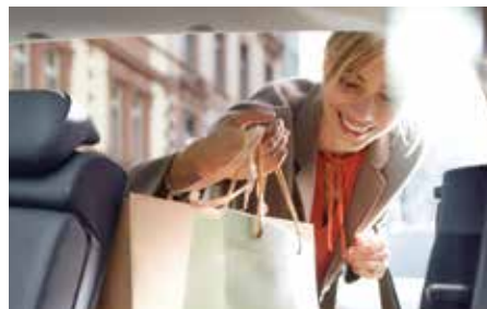
Spațiu generos pentru bagaje