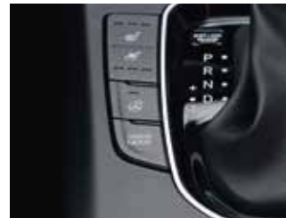
Selectare mod de rulare (Normal / Sport / Eco)