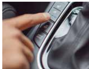
Scaune față ventilate