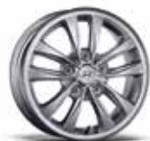
Jante din aliaj de 15"