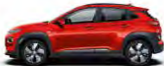
Portocaliu Tangerine Comet (TA9)