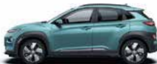
Albastru Ceramic Perlat (SU8)