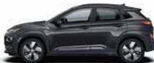
Gri Dark Knight Perlat (YG7)