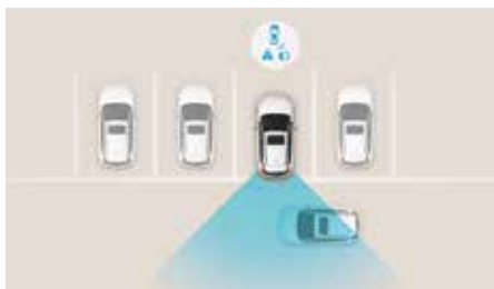
Sistem de avertizare pentru evitarea coliziunilor la deplasarea în marșarier (RCTA)