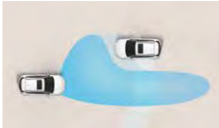
Sistem de asistență pentru faza lungă (HBA)