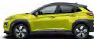
Gri Dark Knight