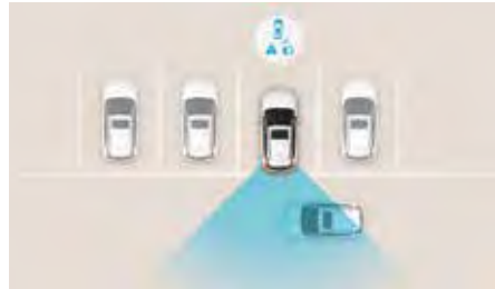
Sistem de avertizare pentru evitarea coliziunilor la deplasarea în marșarier (RCCW)