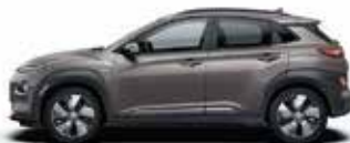
Gri Galactic Perlat (R3G)