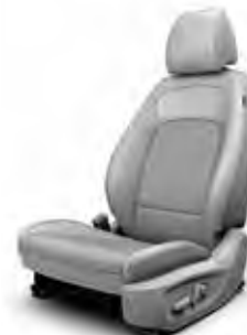
Material textil și piele

Mostrele de culoare prezentate pot varia ușor față de realitate, din cauza condițiilor de iluminare și a procesului de tipărire. Pentru informații complete cu privire la disponibilitatea culorilor și a tapiteriei, vă rugăm să contactați distribuitorii Hyundai Auto România.