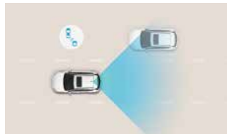
Sistem de monitorizare a unghiului mort (BSD)