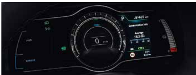
Instrumentar de bord cu ecran color TFT LCD de 7"