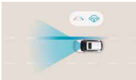
Sistem de asistență la menținerea benzii de rulare (LKA)