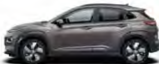
Gri Galactic Perlat (R3G)