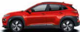
Portocaliu Tangerine Comet Perlat (TA9)