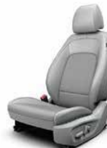
Material textil și piele