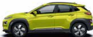
Galben Acid Metallic/ Perlat (W9Y)