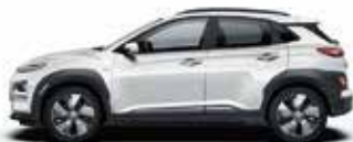
Alb Chalk Metallic (P6W)