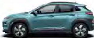
Albastru Ceramic Perlat (SU8)