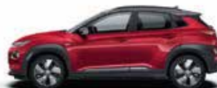
Gri Dark Knight