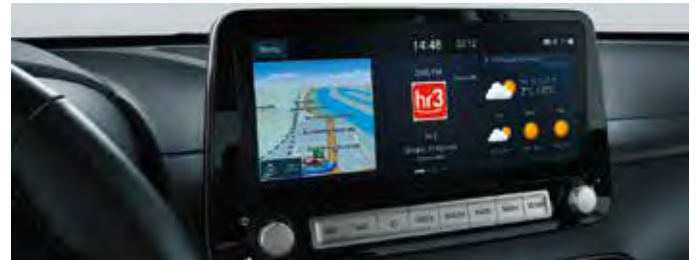
Sistem de navigație cu ecran tactil de 10,25"