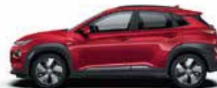
Roșu Pulse Metallic/ Perlat (Y2R)