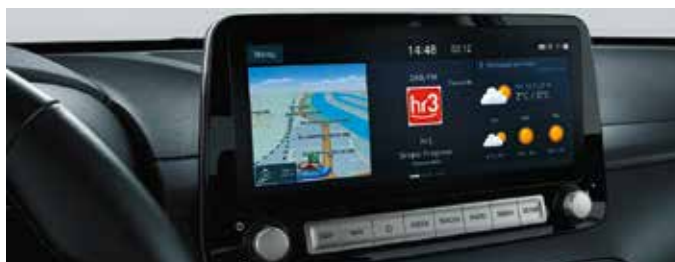
Sistem de navigație cu ecran tactil de 10,25"