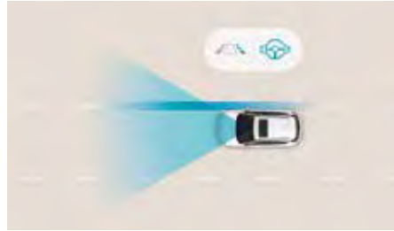
Sistem de asistență la menținerea benzii de rulare (LKA)