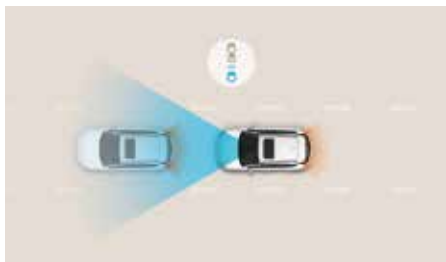
Sistem de asistență la coliziune frontală (FCA) cu detectare pietoni