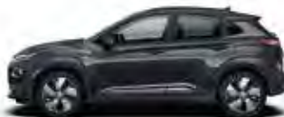
Gri Dark Knight Perlat (YG7)