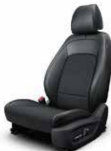
Material textil și piele