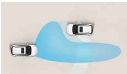
Sistem de asistență pentru faza lungă (HBA)