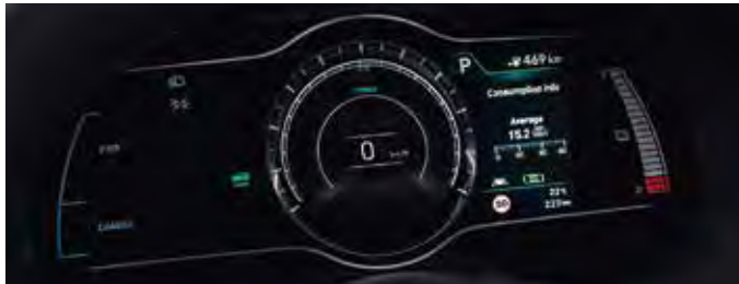
Instrumentar de bord cu ecran color TFT LCD de 7"