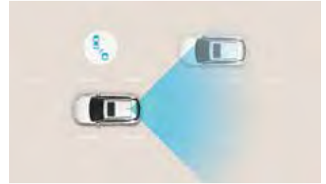
Sistem de monitorizare a unghiului mort (BCW)