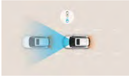
Sistem de asistență la coliziune frontală (FCA) cu detectare pietoni