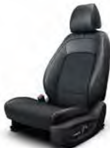
Material textil și piele