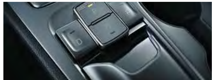
Consolă pentru schimbarea pozițiilor de condus „shift-by-wire”