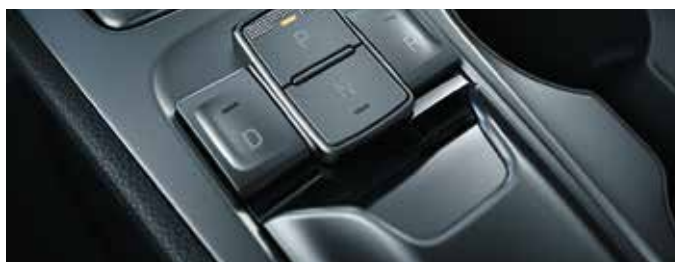
Consolă pentru schimbarea pozițiilor de condus „shift-by-wire”