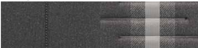
Gri Shale (YPK)