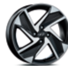
Jante din aliaj de 16"

Informațiile prezentate în acest pliant se bazează pe datele disponibile la momentul publicării. Acestea sunt orientative și nu reprezintă parte integrantă a ofertei de produs. Este posibil ca unele echipamente ilustrate sau prezentate să nu fie disponibile în echiparea standard, putând fi achiziționate contra cost. Hyundai Auto România își rezervă dreptul de a schimba specificațiile tehnice și echipările fără un anunț prealabil. Garanția de 5 ani fără limită de kilometri se aplică doar autovehiculelor Hyundai care au fost vândute inițial de către distribuitorul autorizat Hyundai către clientul final, conform termenelor și condițiilor prezentate în pașaportul de service. Pentru informații complete, vă rugăm să contactați distribuitorii Hyundai Auto România. Imaginile disponibile sunt cu titlu de prezentare.