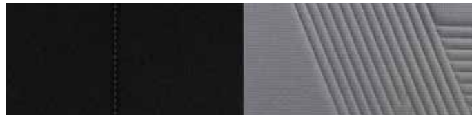
Brass Metal (PRG)